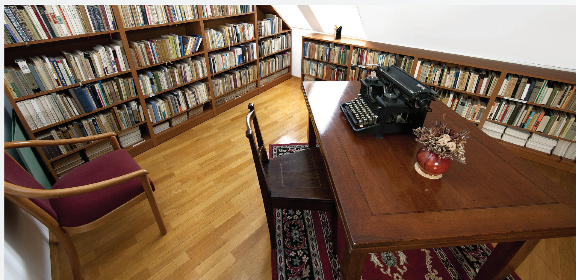
Udovičeva soba v Knjižnici Jožeta Udoviča