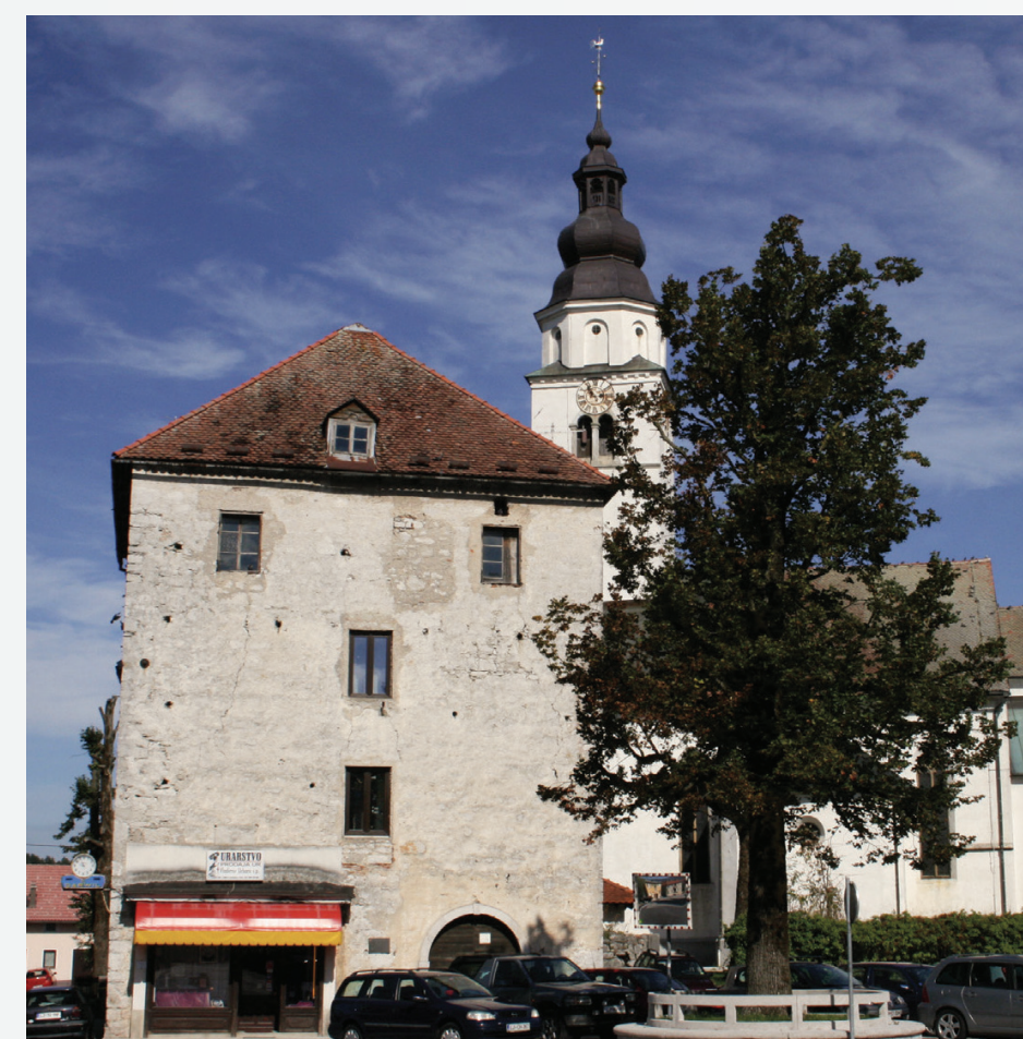
Obrambni stolp v Cerknici, pesnikova rojstna hiša